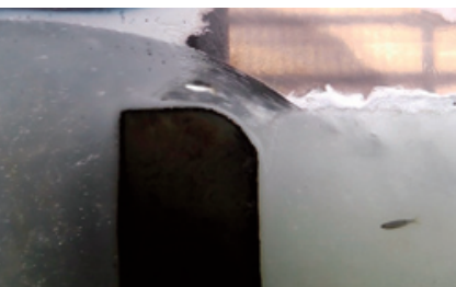
魚道の流れと魚の遡上(さかのぼり)の様子を 実際の現場のスケールで映像で 表示しています

この企画展では、魚道の基礎知識と現場の取り組み、そして魚道 を利用する生物の営みについて、パネルだけでなく、映像や模型を 活用した展示を通じてわかりやすく解説します。